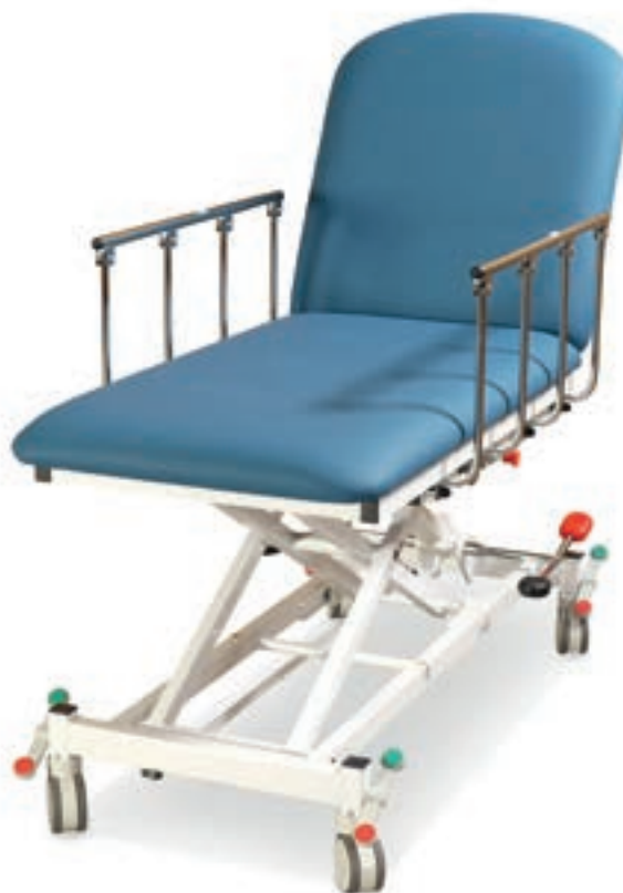
Abb. zeigen Mod. 2030-00XL/H mit Sonderzubehör:

Mod. 1180N (Rollen zentral feststellbar)