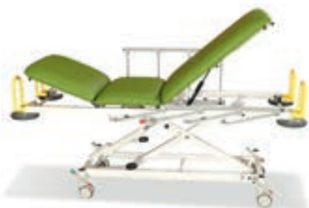
Abb. zeigen Modell 1095-00/H in der Grundausstattung