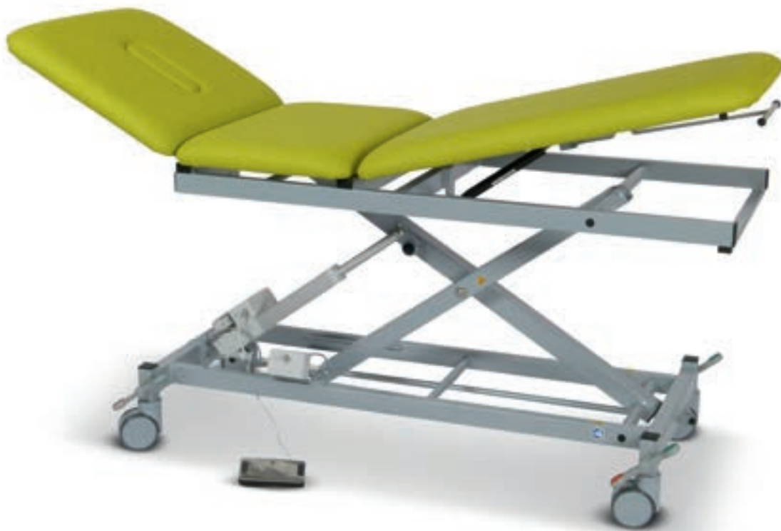
Abb. zeigt Mod. 1050-04 , elektromotorisch höhenverstellbar (Untergestell in Farbe RAL 9007) mit Sonderzubehör: Mod. 046 (Rollen zentral feststellbar)