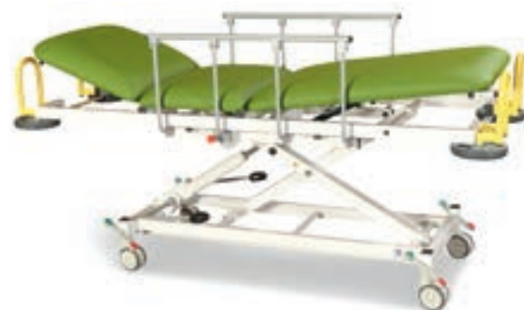
Abb. evtl. mit Sonderzubehör

Basierend auf der seit Jahrzehnten bewährten Dewert-Technologie in Kombination vieler Einzelfaktoren wie Achsen-Lagerung und - Stärke, Rollen-Führungen, Materialabmessungen und Materialstärke entstand unsere Liegenserie DX1 .