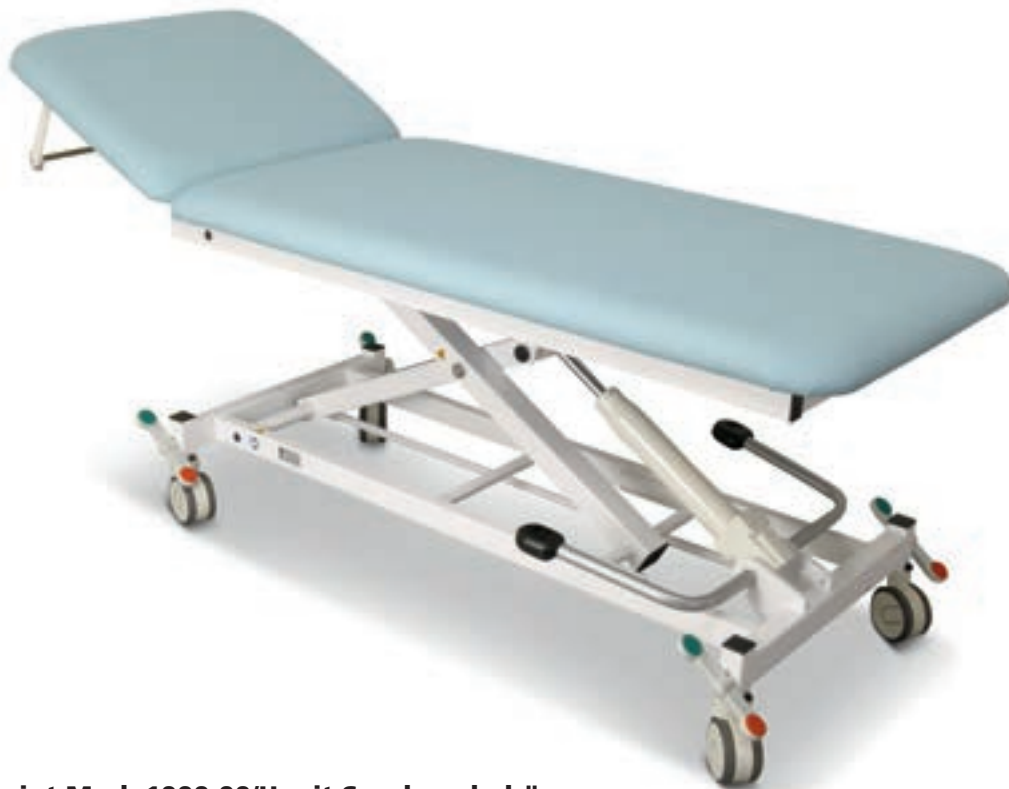
Abb. zeigt Mod. 1000-00/H mit Sonderzubehör: