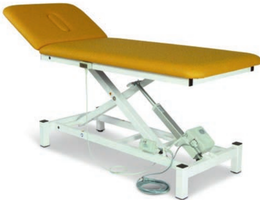
Abb. zeigt Mod. 1000-00 in der Grundausstattung mit Handschalter