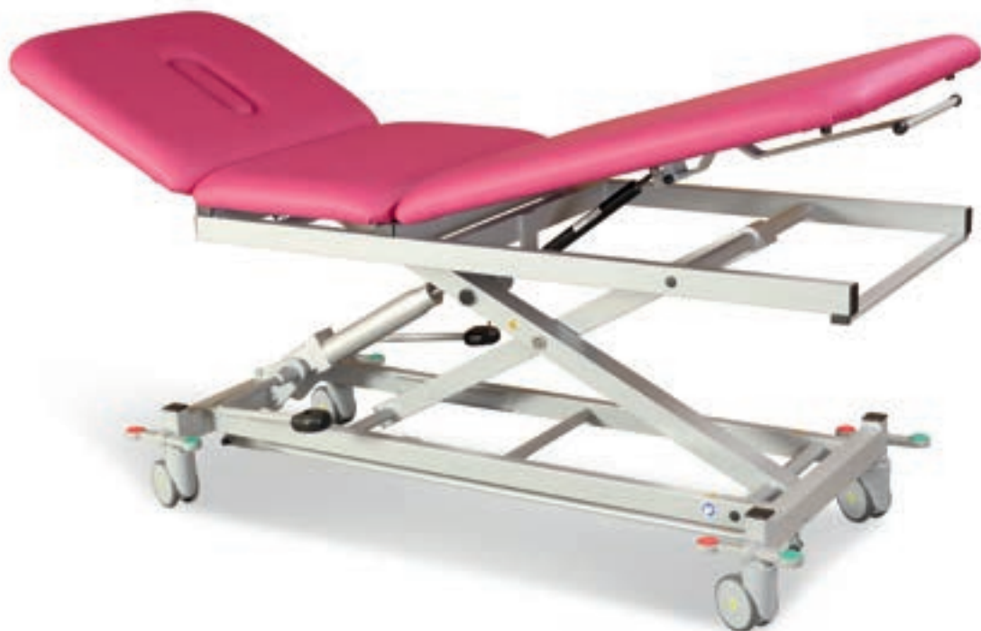
Abb. zeigt Mod. 1050-04/H , hydraulisch manuell höhenverstellbar (Untergestell in Farbe RAL 9006) mit Sonderzubehör: Mod. 046 (Rollen zentral feststellbar)