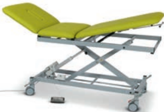
.....die DX1 1050er-Reihe