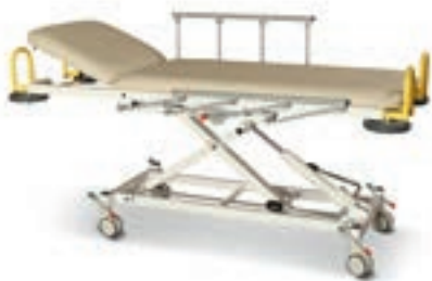
Abb. zeigen Modell 1090-00/H in der Grundausrüstung