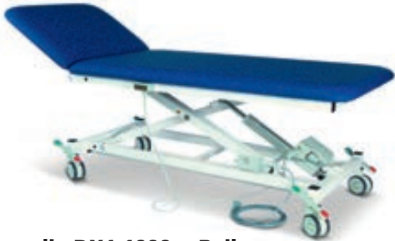
.....die DX1 1000er-Reihe