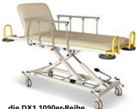
.....die DX1 1090er-Reihe