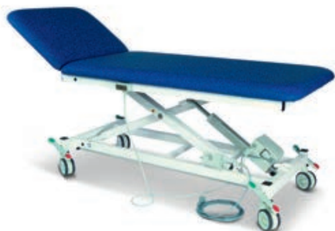
Abb. zeigt Mod. 1000-00 mit Handschalter und mit Sonderzubehör: Mod. 046 (Rollen zentral feststellbar) Mod. 1615-EF (Entfall Nasenschlitz)