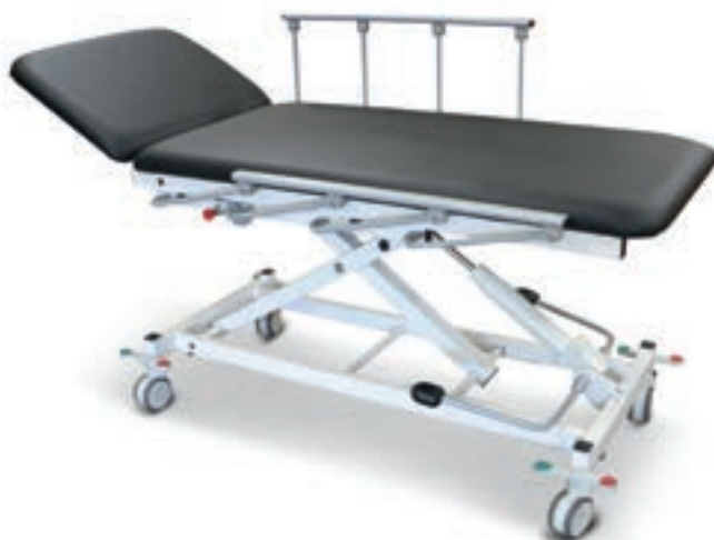
Abb. zeigt Mod. 1000-00/H mit Sonderzubehör: