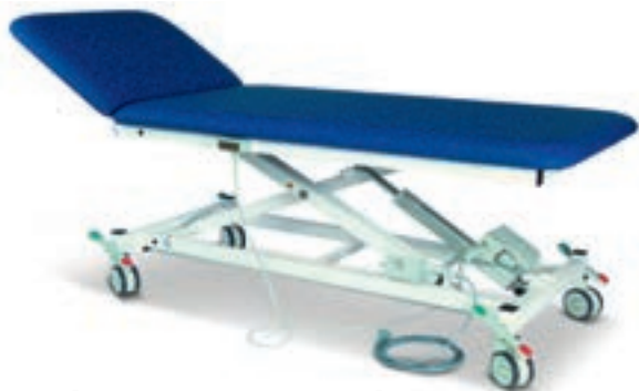
.....die DX1 1000er-Reihe