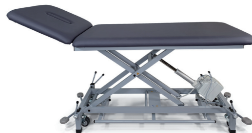
Modell 2000-04XLE mit Ausstattungsoptionen: Rad-Hebe-System (1045N), umlaufende Fußbedienung (1960E), Nasenschlitz und Füllpolster (1610, 1620)