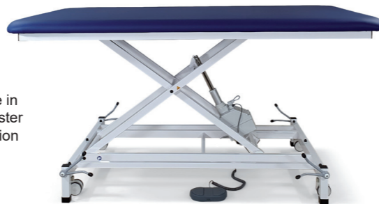
Liege in höchster Position