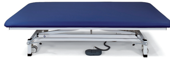
Liege in niedrigster Position