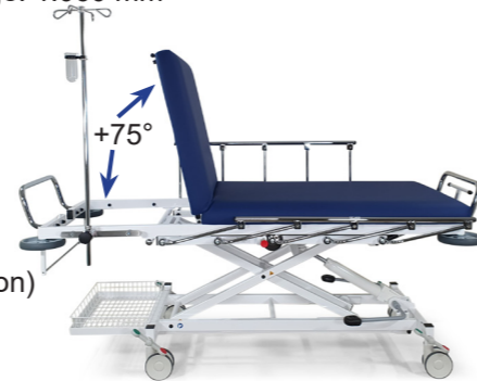
Abb. zusätzlich: Befestigungskloben für Normschiene (1430), Infusionsstange für Normschiene (1450) mit Zubehör